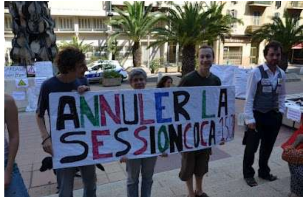
Ultimatum : annuler la session Coca-Cola...

Après quelques promesses vaseuses des organisateurs (10 minutes d'intervention en plénière devant tous les participants), dont nous n'avons finalement pas vu la couleur, à l'heure dite du début de la session Coca-Cola, nous avons décidé de forcer l'entrée du congrès grâce à un redoutable regroupement non-violent d'une dizaine de personnes qui a réussi à rentrer dans l'Acropolis tout en chantonnant un air hautement guerrier bien connu : « Il en faut peu pour être heureux, vraiment très peu pour être heureux, il faut se satisfaire du nécessaire... »... mais nous avons été bien vite repoussés par les vigiles. Puis l'arrivée de la police nous a fait renoncer à toute action plus violente (nous nous préparions même à un transport musclé vers la garde à vue la plus proche...).