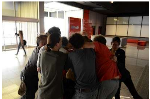
Entrée agitée dans le lieu du congrès

Le reste de l'après-midi nous a donc permis de développer nos autres modes d'actions : une nouvelle fois, le participant sortant du congrès pouvait rencontrer la brigade de clowns qui continuait d'officier. Il pouvait croiser une canette de Coca-Cola tenant en laisse en médecin, qui prescrivait du Coca à tire larigot et à vie !