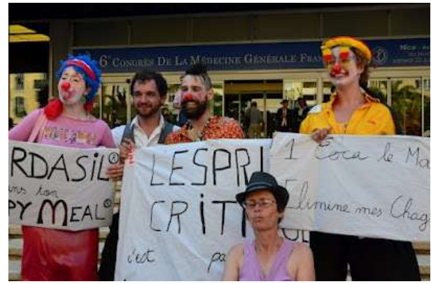
Les clowns en pleine action

S'il était intéressé et s'avancait un peu, le participant pouvait tomber sur un stand un peu plus sérieux sur lequel s'agglutinaient paparazzis, caméras et micros (fantasme, quand tu nous tiens...). Il pouvait y débattre sérieusement sur l'indépendance et les conflits d'intérêts, et récupérer de la documentation sur le Formindep et sur Voix Médicales, ainsi que sur le sens de cette action. Il risquait d'en sortir couvert d'autocollants, et avec la mission d'en recouvrir les autres participants et organisateurs du congrès.