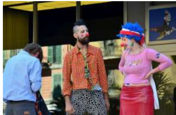
Coca tenant en laisse un médecin... Et clowns.

Il pouvait aussi rencontrer un bien curieux père Noël, qui l'incitait à se purger de ses conflits d'intérêts et repartir du congrès la conscience tranquille en jetant dans sa hotte ou dans une grande poubelle ses sacoches, stylos et autres prospectus donnés par les industriels. La récolte a été bonne, et chaque acte de purification était l'occasion de vivats et d'applaudissements à tout rompre !