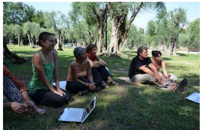
Les coulisses de l'action... Préparation !