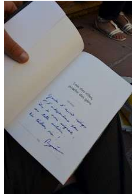
L'heure du bilan (toujours devant l'Acropolis)... et un émouvant cadeau.