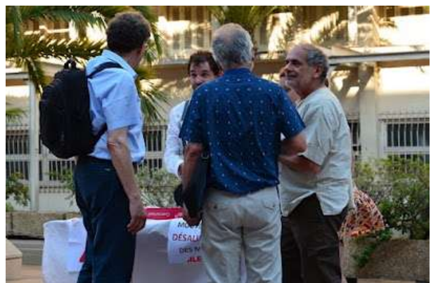
Discussions avec les participants

Ca c'était la journée du jeudi. J'ai cru comprendre que l'action du vendredi a été un peu plus musclée ?