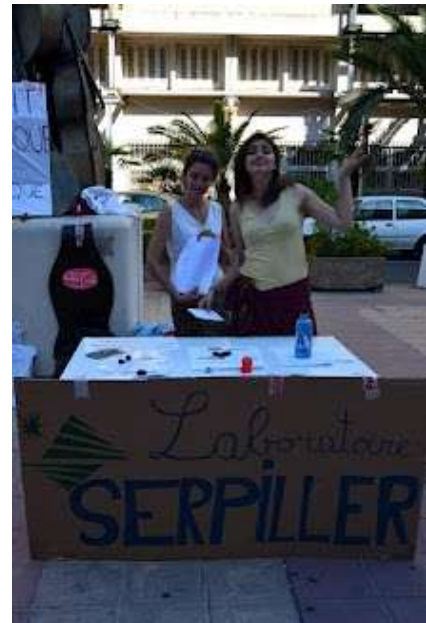
Les laboratoires Serpiller, présents en force !

Il pouvait également être abordé par des VRP de Ricard et de Monsanto, qui souhaitaient vivement être partenaires du congrès en 2013, et qui essayaient donc de convaincre qu'ils valaient tout aussi bien que MacDonalds et Coca-Cola ! Le thème de leur « session partenaire » était déjà tout trouvé : « Regards croisés sur la santé des agriculteurs ».