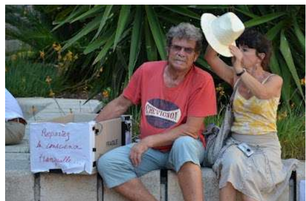
Repartez la conscience tranquille, purifiez-vous de vos conflits d'intérêts !

Le participant pouvait également commencer la construction d'alternatives avec nous, en notant sur un grand tableau ses idées pour rendre la Formation Médicale Continue indépendante, et en contribuant à une liste des alternatives médicales indépendantes. Toute cette matière sera bien sûr envoyée au Comité d'Organisation du congrès.